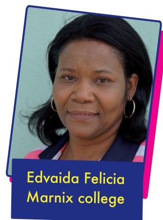
Edvaida Felicia Marnix college